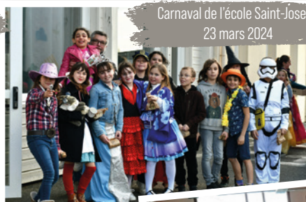
Carnaval de l'école Saint-Joseph 23 mars 2024