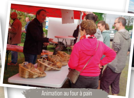
Animation au four à pain 14 avril 2024