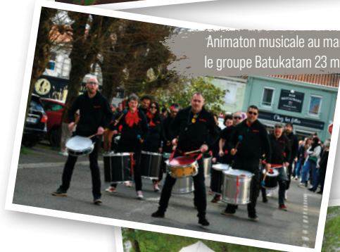
Animation musicale au marché par le groupe Batukatam 23 mars 2024