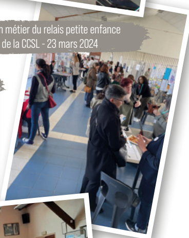
Forum métier du relais petite enfance de la CCSL - 23 mars 2024