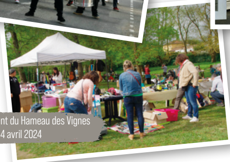
Vide-lotissement du Hameau des Vignes 14 avril 2024