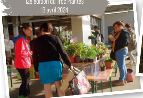
12e édition du Troc Plantes 13 avril 2024