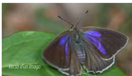
Verso d'un imago