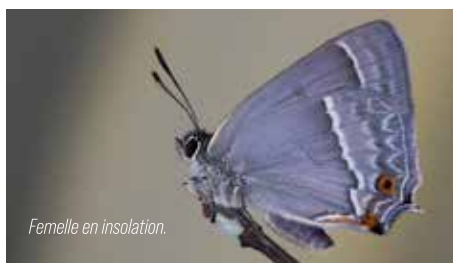
Femelle en insolation.