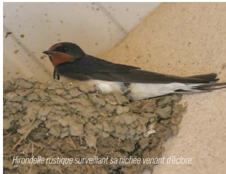
Hirondelle rustique surveillant sa nichée venant d'éclore.

Nous comptons donc sur vous tous, habitants ou visiteurs du Pallet, pour respecter, a minima, la législation dans ce domaine.