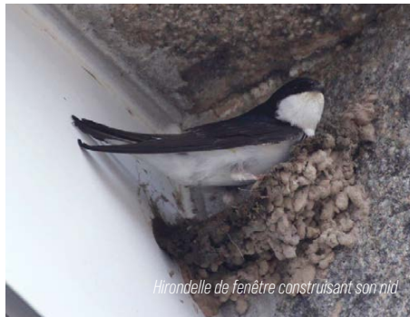
Hirondelle de fenêtre construisant son nid.

Nous devons rappeler enfin que l'Hirondelle de fenêtre et l'Hirondelle rustique sont des espèces protégées sur l'ensemble du territoire français (arrêté ministériel du 29 octobre 2009) et que la destruction intentionnelle des nids est interdite, œufs ou couvées d'espèces animales sauvages protégées (article L415-3 du code de l'Environnement).